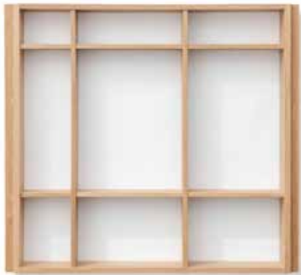
Höhe Einsatz ohne Boden: 59 mm